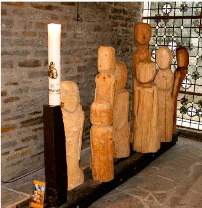
Entstanden in der ersten Bonifatiuswoche: Der Bonifatiusleuchter.

Das Markenzeichen der Gemeinde in Bielstein