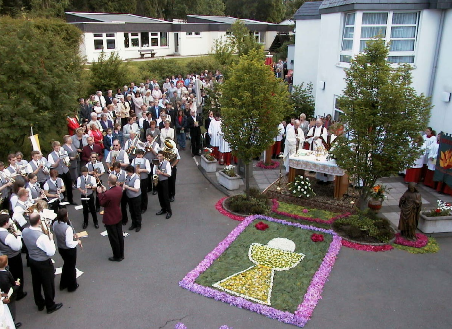
Sakramentsprozession – ein besonderes Element von Fronleichnam.

keinen festlichen Rahmen erhalten. Die Nonne Juliane von Lüttich hatte 1209 wiederholt Visionen, dass im Kreis der liturgischen Feste ein Fest zu Ehren des hl. Altarsakramentes fehle. Zuerst führte es 1246 der Bischof von Lüttich für seine Diözese ein und 1264 dann Papst Urban IV. für die ganze Kirche. Die Ostkirche kennt dieses Fest nicht.