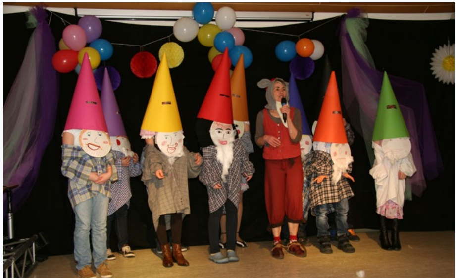
Jedes Jahr führt die Kirchenmaus durchs bunte Programm.

Jedes Jahr feiern wir gemeinsam im Pfarrsaal der katholischen Kirche Wiehl. Zum Programm gehören eine Reihe von lustigen Auftritten, Musik und natürlich der Auftritt des Denklinger Karnevalsvereins und das alles bei Verpflegung. Einlass ist ab 18:30 h und das Programm startet ab 19:11 h. Das