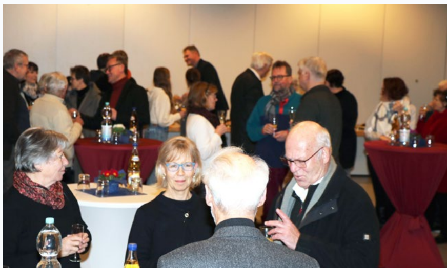
Eingeladen sind alle Gemeindemitglieder und Seelsorger des Sendungsraumes.

Zunächst lud noch der lokale Pfarrgemeinderat die Gemeindemitglieder von St. Michael und den Filialgemeinden Nümbrecht, Schönenbach und Ziegenhardt ein. Dann wurde im Jahr 2008/2009 der Seelsorgebereich »An Bröl und Wiehl« errichtet. Der lokale Pfarrgemeinderat wurde vom Ortsausschuss abgelöst. Selbstverständlich erfolgte die Einladung dementsprechend an alle