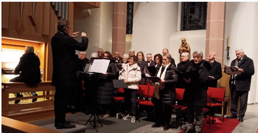
Das Cäcilienfest begann mit einem musikalisch feierlich gestalteten Festgottesdienst.

Von 1985 bis 2019 feierte der Kirchenchor St. Cäcilia Waldbröl jedes Jahr am Wochenende vor dem 1. Advent, an Christkönig, sein traditionelles Cäcilienfest. Die hl. Cäcilia von Rom ist Patronin der Kirchenmusik. Ihren