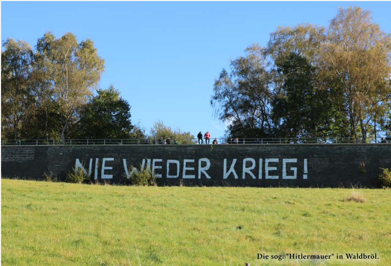
Die sog. "Hitlermauer" in Waldbröl.

Deutschland erfreut sich der längsten Periode ohne Krieg seit Menschen-gedenken. Wir wissen aber, dass die Konflikte näher rücken, dass wir in einem labilen Frieden und in trügerischer Sicherheit leben. Denn wir leben nicht auf einer Insel, sondern stehen als wirtschaftliche Großmacht in einer besonderen Verantwortung, trotz unserer historischen Belastung.