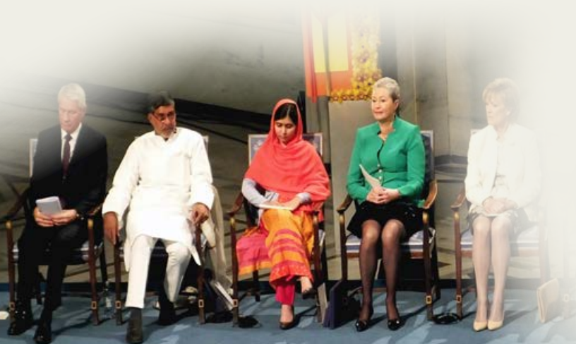
Bild: Friedensnobelpreisverleihung 2014 an Malala Yousafzai (3. v. l.) und Kailash Satyarthi (2. v. l.)