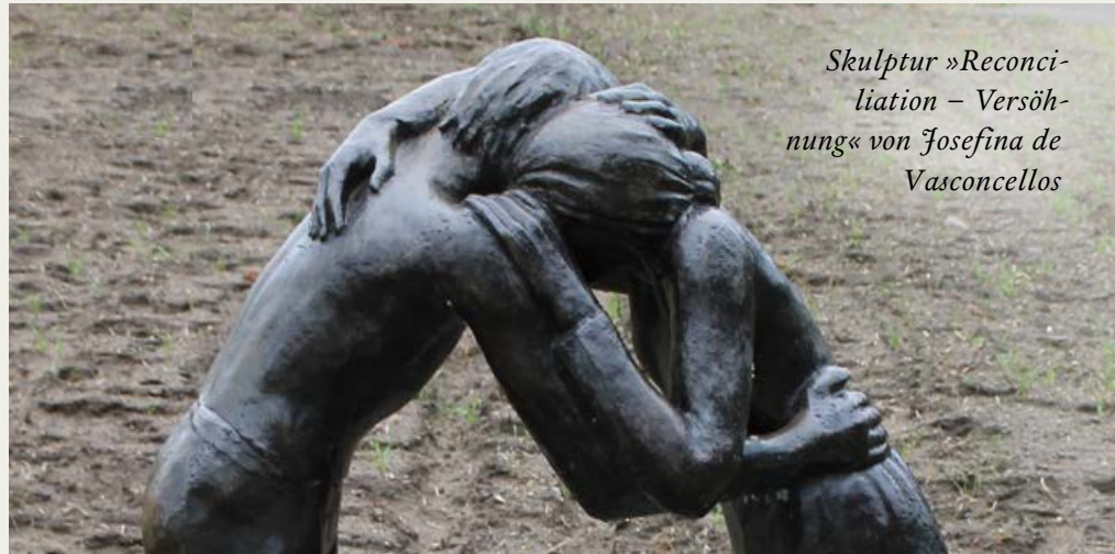
Skulptur »Reconciliation – Versöhnung« von Josefina de Vasconcellos

In ihrem ausführlichen geschichtlichen Rückblick gingen die polnischen Bischöfe auch auf die unselige gewaltsame »Missionierung« durch die Kreuzritter ein. Dies sei noch heute ein Schreckgespenst für jeden Polen, das allzu oft mit den Deutschen identifiziert werde. Sie sparten auch nicht das unendliche Leid aus, das durch die deutsche Besatzung während der Nazi-Zeit über das polnische Volk gekommen war: »Über sechs Millionen polnische Staatsbürger, darunter der Großteil jüdischer Herkunft, haben diese Okkupationszeit