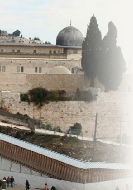
Bild: Klagemauer in Jerusalem