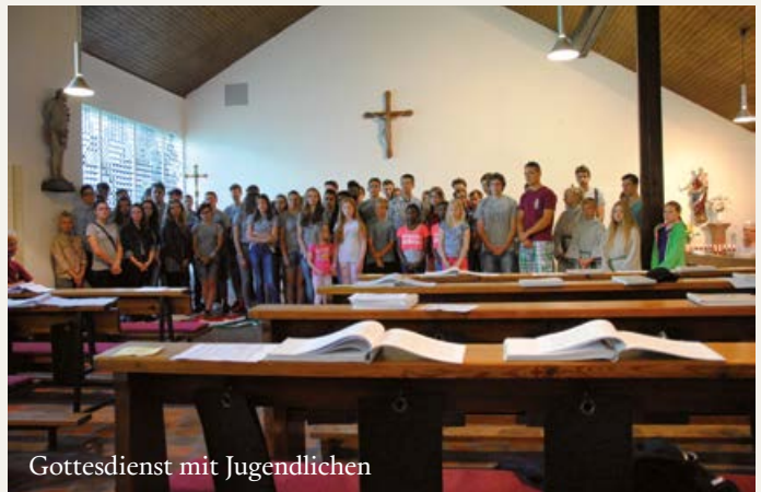
Gottesdienst mit Jugendlichen