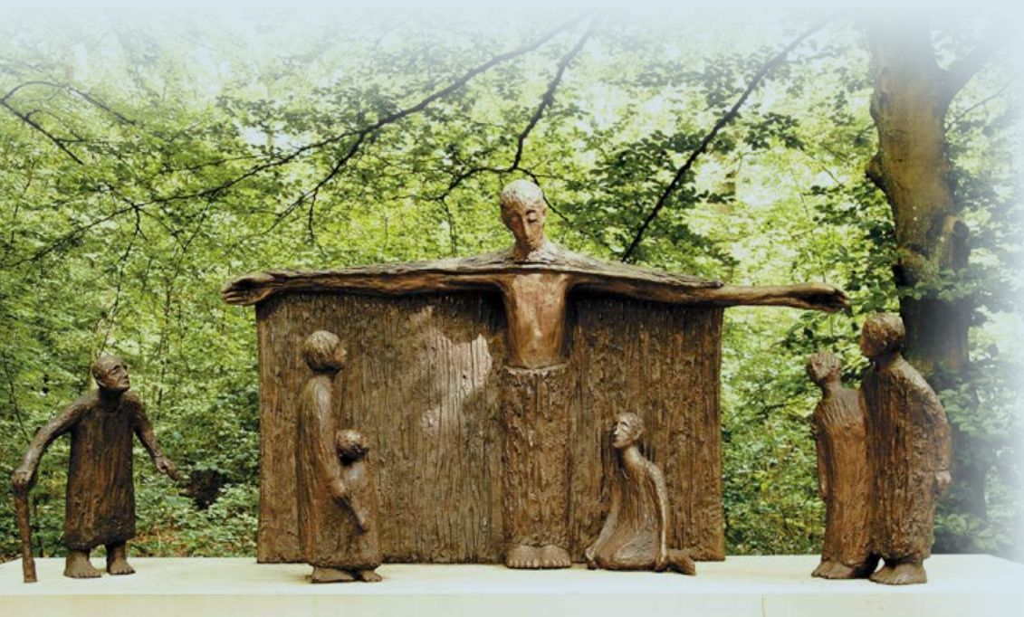
Bild: Altar mit dem Schutzmantelchristus am Eingang des Friedwaldes Schwanenberg

Gewiss kann man hier auch den weihnachtlichen Frieden empfangen. Möchten Sie mit mir dorthin gehen? ■